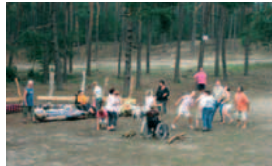
samen sporten en picknicken in het bos

Jaarlijks organiseren we een logeerweekend voor de droomhuiskids, zodat zij alvast kunnen wennen aan hun nieuwe groep. Dit jaar trokken wij met zijn allen – ouders en kinderen – naar de Miggelenberg in Hoenderloo, waar wij een aantal bungalows gehuurd hadden. Ook het aanstaande zorggezin was van de partij. Het klikte geweldig en we hebben veel plezier gehad. Hoogtepunt was de huifkarrit met dravende paarden, maar ook het zwemmen in het subtropisch zwemparadijs en de fietstocht over de Hoge Veluwe vielen in goede aarde. De kinderen hadden ook heel veel plezier met elkaar.