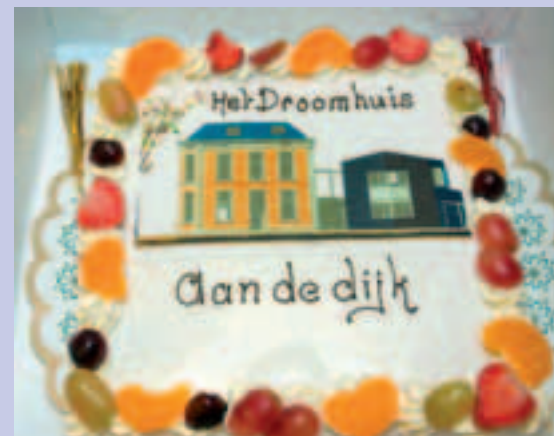
Deze taart kreeg de Woningstichting van ons cadeau